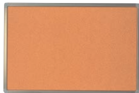
① コルクボード 91