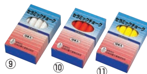
⑨ ⑩ ⑪