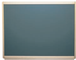
④ ウットーチョークグリーン (壁掛黑板) 94