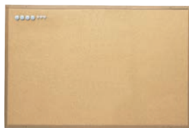
② マグピンコルクボード 92